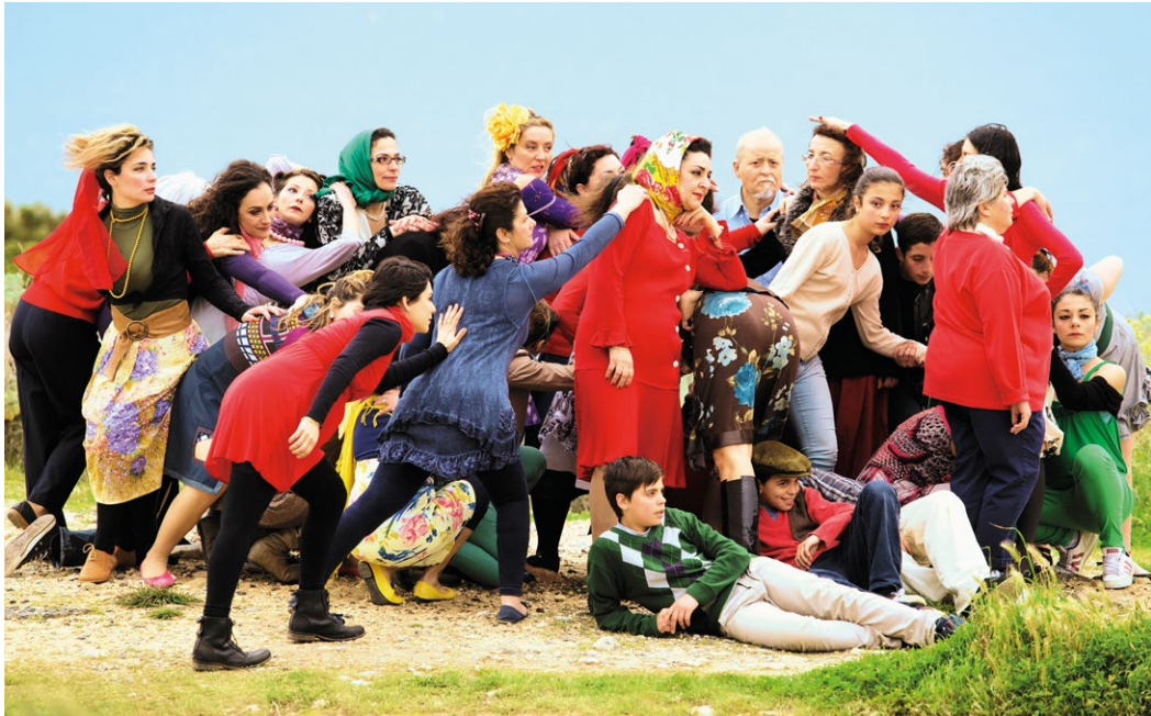
The School of Narrative Dance, Little Chaos, 2013