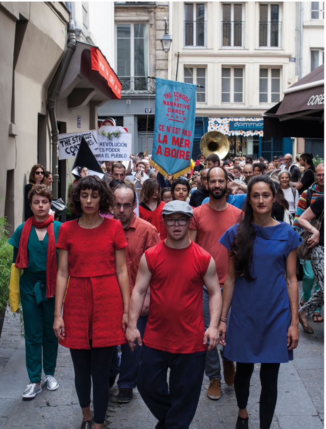
The School of Narrative Dance, Paris, 2017, als Teil von MOVE, Centre Pompidou, Paris