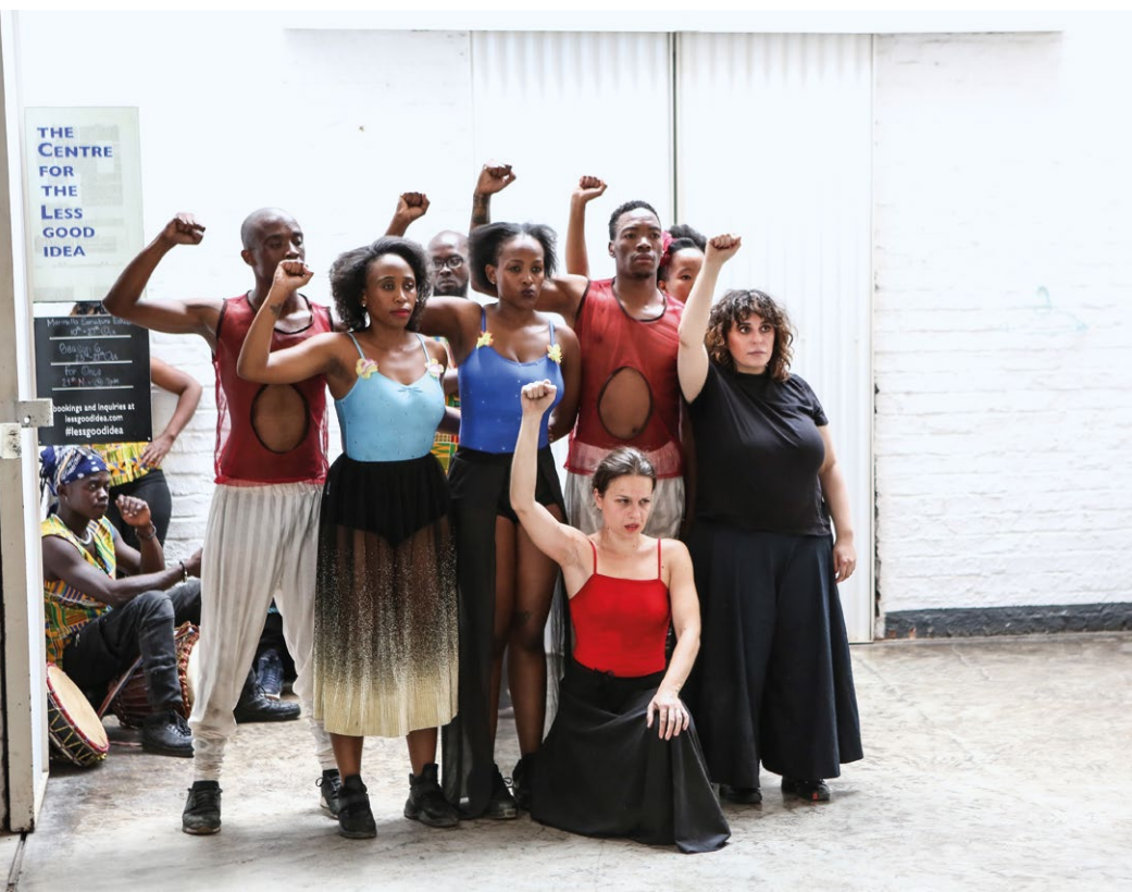
The School of Narrative Dance, Johannesburg, 2019, The Centre for the Less Good Idea, Johannesburg