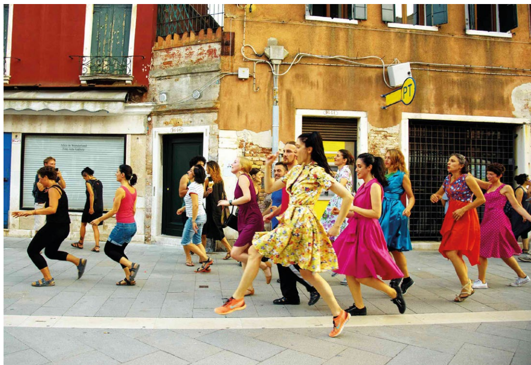
The School of Narrative Dance, Venice Parade, 2015, als Teil von The Creative Time Summit at the 56th Venice Biennale, Venedig