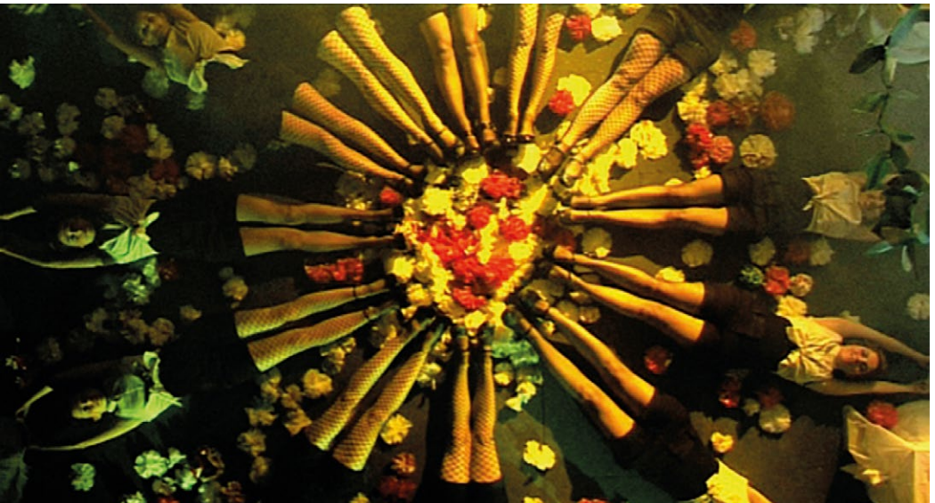
Speak Easy – Director's Cut, 2009