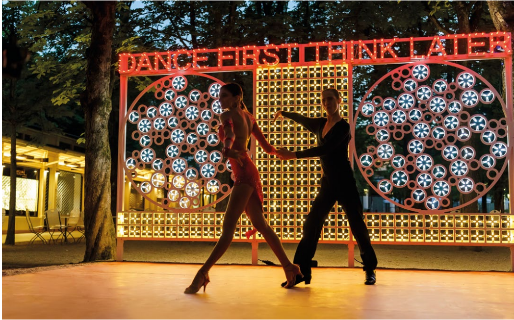
Dance First Think Later, 2022