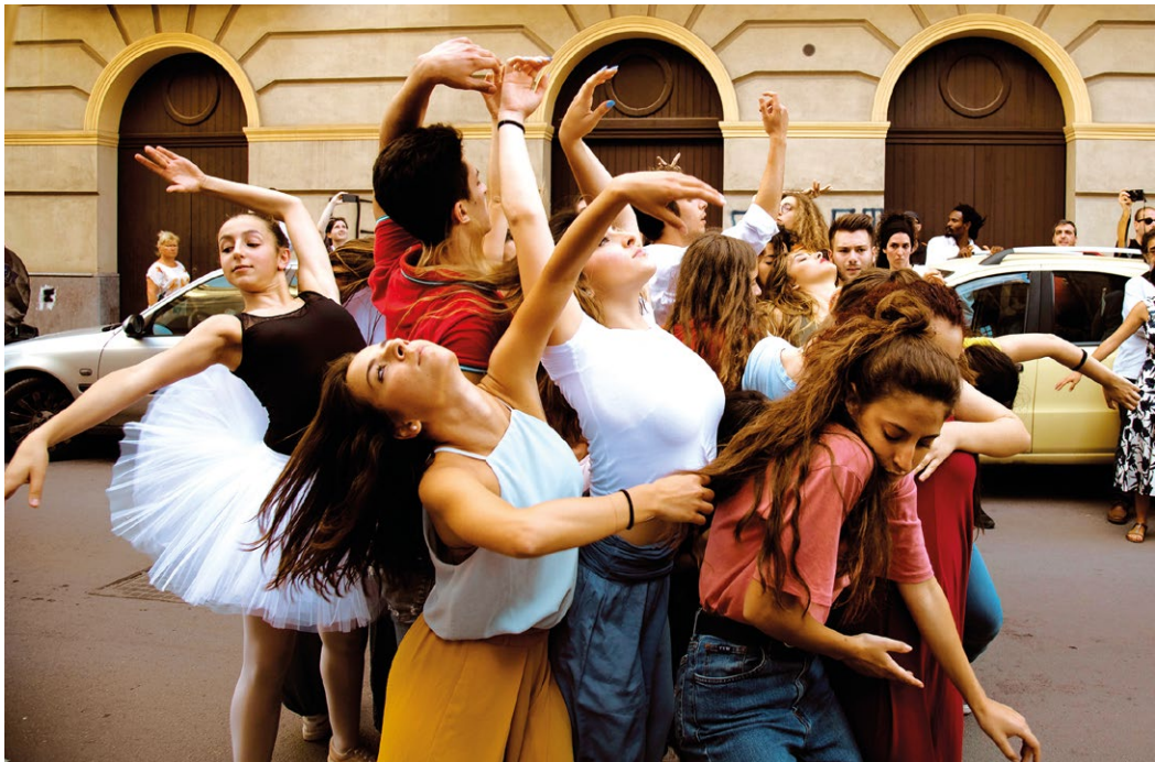
The School of Narrative Dance, Palermo Procession, 2018, als Teil von Manifesta 12, Palermo

2012 kommt es in Berlin zur ersten Umsetzung der School of Narrative Dance . Seitdem folgen über 30 weitere Ausgaben, unter anderem in Cold Spring, Cuenca, Ebensee, Évora, Kopenhagen, Johannesburg, London, New York, Oulu, Palermo, Paris, Rom, Shenzhen, Stockholm, Turin, Venedig und Zürich. Der mit jeder Ausgabe erweiterte Videofilm Ongoing Documentary zeigt die fortlaufende Geschichte von The School of Narrative Dance .