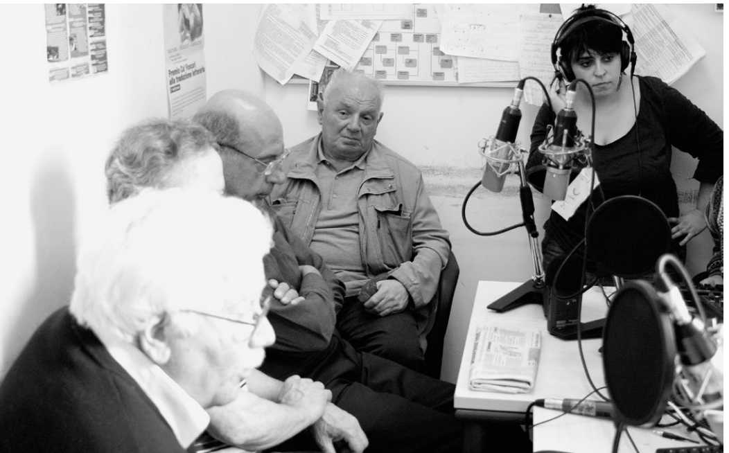
Estman Radio Drama, 2011, Produktionsfotos, Tonaufnahmen bei Radio Ca' Foscari, Venedig