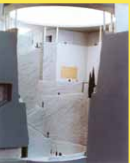
Oskar Kokoschka, Pietà, 1909, Plakat für die „Kunstschau Wien“, Farb lithografie, Museum der Moderne Salzburg, Fondation Oskar Kokoschka/Bildrecht, Wien 2015 | Andrea Fraser, Official Welcome, 2001/2003, Performance, Videostill der Live-Performance in Hamburg, Sammlung Generali Foundation – Dauerleihgabe am Museum der Moderne Salzburg | Hans Hollein, Guggenheim Museum im Mönchsberg, 1990, Schnittmodell, © Archiv Hans Hollein | Dan Graham, New Design for Showing Videos, 1995, Installationsansicht (Ausschnitt) © Sammlung Generali Foundation – Dauerleihgabe am Museum der Moderne Salzburg, Foto: Werner Kaligofsky